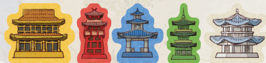
Sąd Garnizon Spichlerz Targ Warsztat

Po umieszczeniu kafla, możesz wznieść pagodę, jeśli 3 kafle tego samego koloru zostały ułożone w taki sposób, że tworzą one „trójkąt”, pod warunkiem, że: