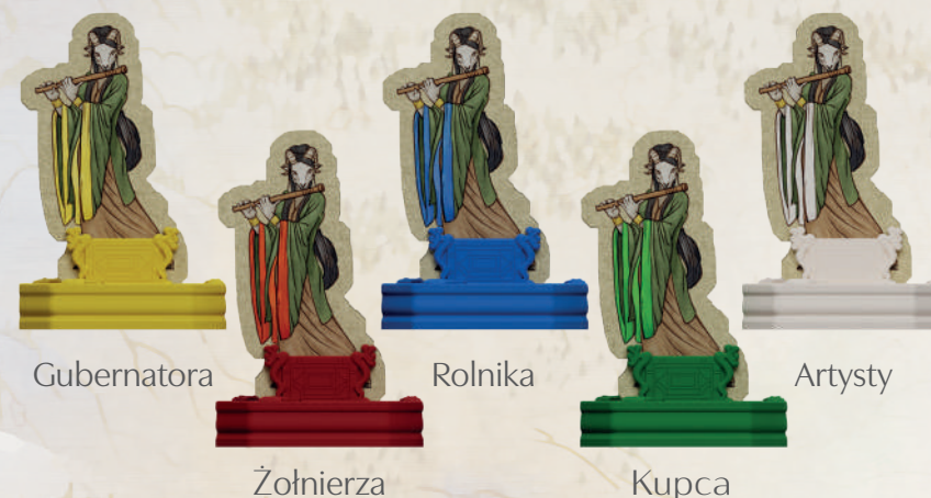
Pięciu przywódców Dynastii Kozy

Kontrolujesz Dynastię składającą się z 5 przywódców. Każdy z nich ma taki sam kształt, lecz różnią się oni kolorami, które odpowiadają 1 z 5 rodzajów kafli: