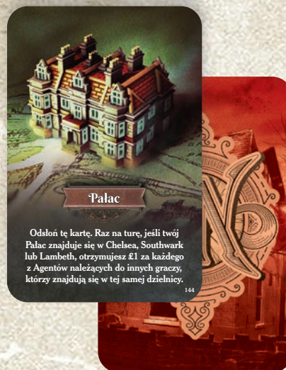
przykład karty Budynku

Nie wyjawiaj nikomu swoich kart Agentów, dopóki ich nie zagrasz. Możesz używać zdolności tych kart w dowolnej chwili podczas swojej tury (tak jak z umiejętnościami kart Dzielnic). Niektóre z tych zdolności to Akcje, których możesz użyć tylko raz, niektóre mają stale działający efekt, a niektóre są Reakcjami. Dokładne opisy zdolności znajdują się na kartach.