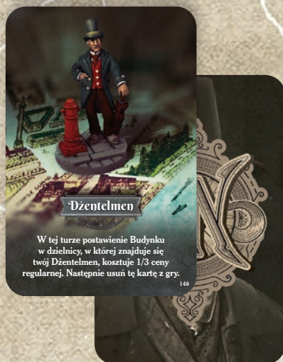
przykład karty Agent

Podczas rozkładania gry, zanim gracze zaczną rozmieszczać swoje figurki na planszy, potasuj talię kart Agentów i rozdaj po 3 każdemu z graczy 8A . Jeśli jakieś zostały, odłóż je do pudełka zakryte. Następnie potasuj talię kart Budynków i rozdaj po 1 każdemu z graczy 8B . Resztę odłóż zakryte obok planszy 8C . Każdy gracz musi się teraz zastanowić, jakie figurki Agentów rozmieścić na planszy w ustawieniu początkowym.